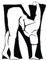
Kuva 2. Erillinen N-alkukirjain